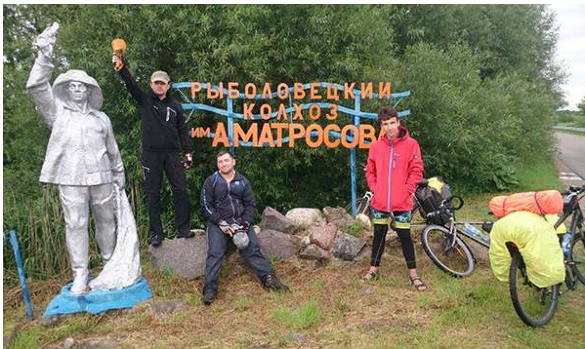
Вдоль Полесского канала