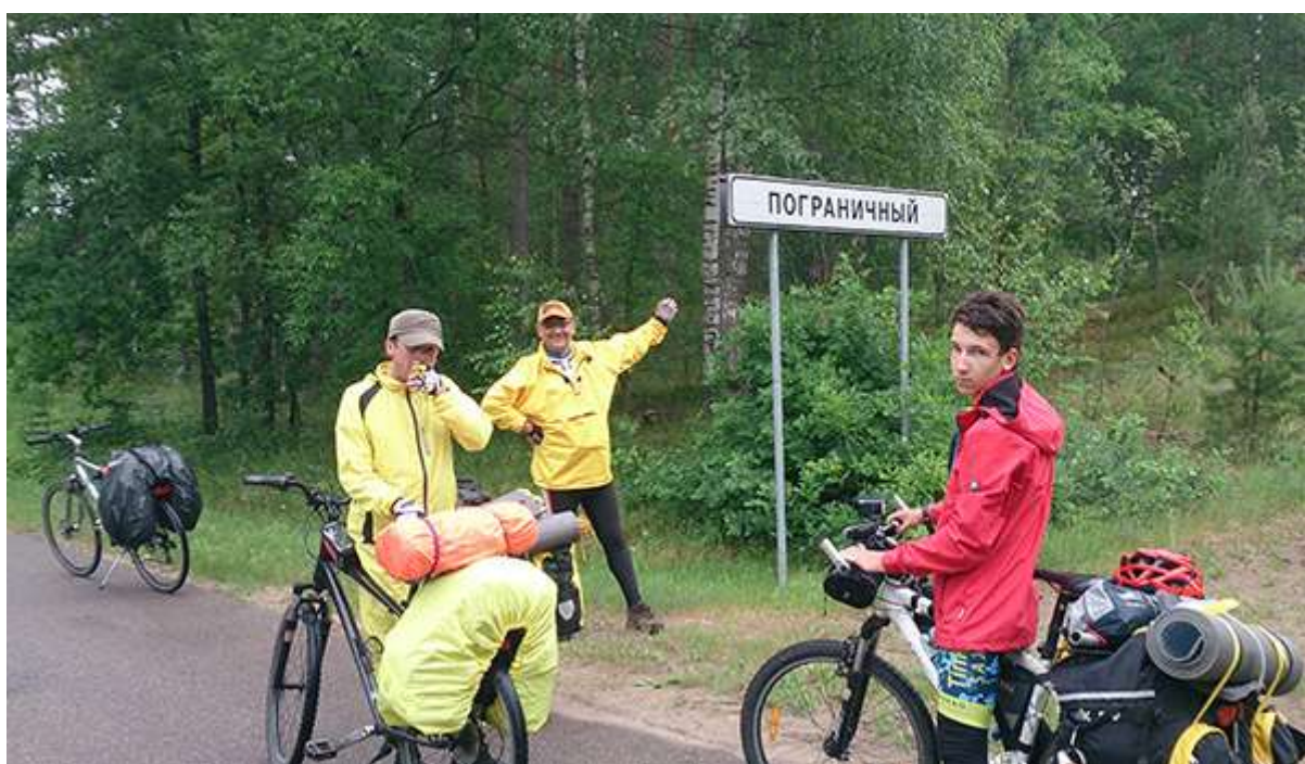
На въезде в Пограничный