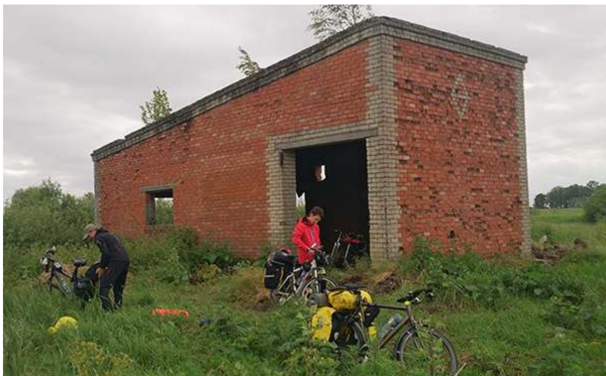
Утренние сборы после ночевки в Лунино