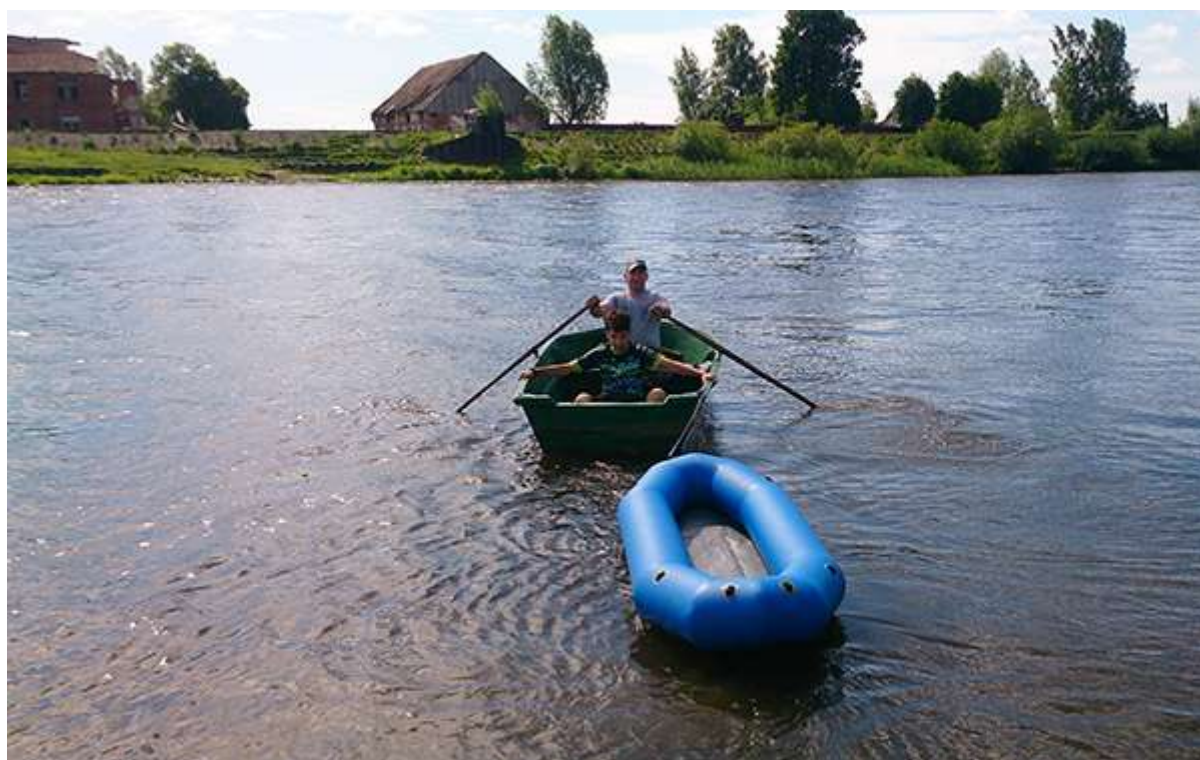
Переправа в Заповедном