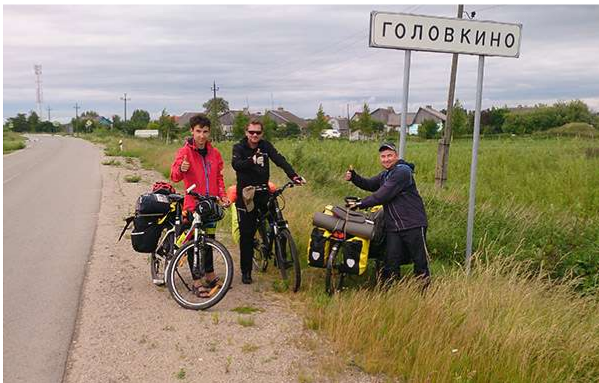
На въезде в Головкино