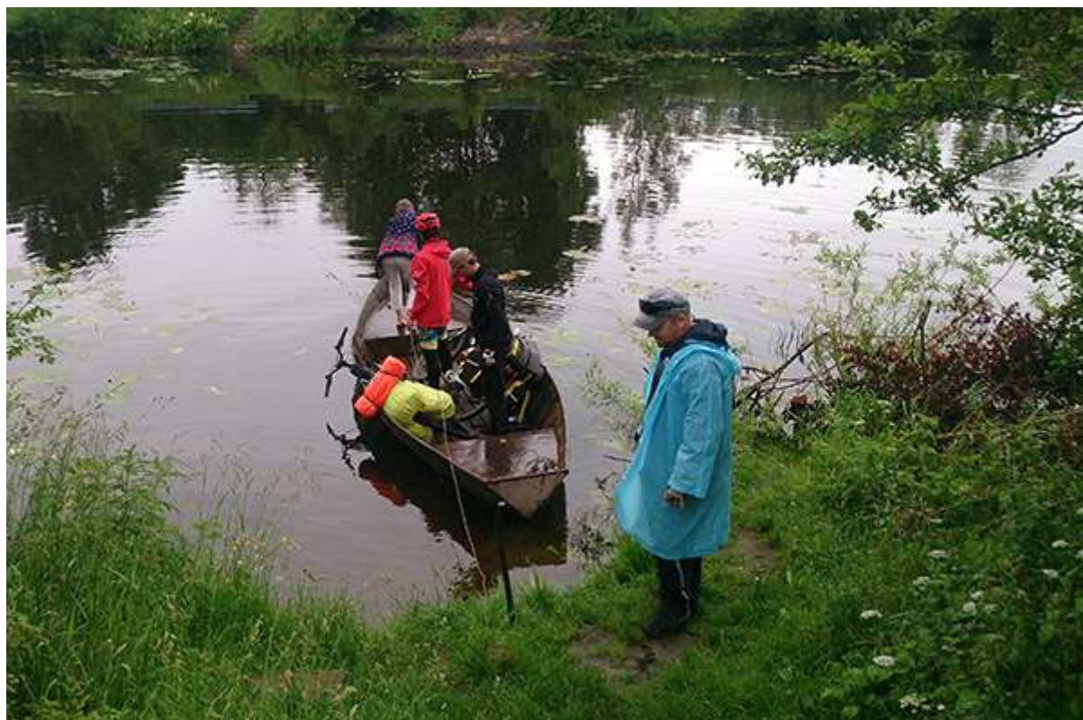
Переправа в Красном